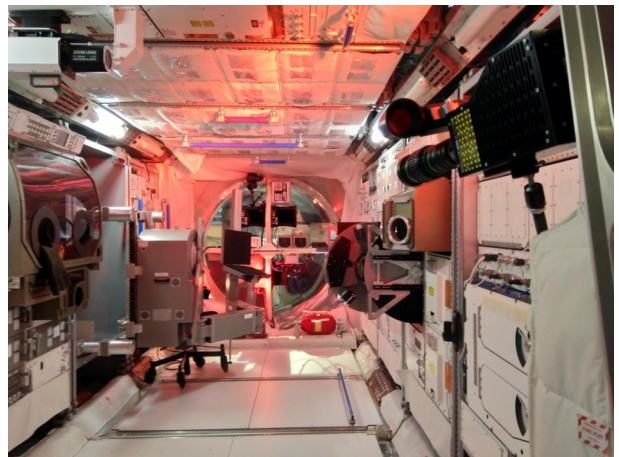
Interior del módulo "Columbus".